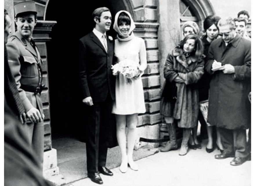
Audrey Hepburn épouse Andrea Dotti à Morges en 1969