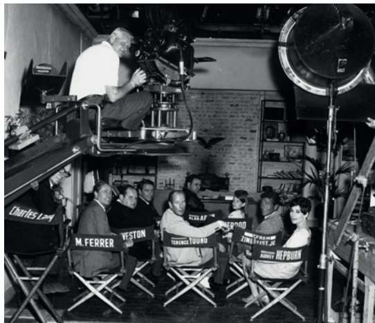
Sur le tournage de « Seule dans la nuit » en 1967

Des extraits de films, des photographies, des affiches de cinéma sont présentés à l'Expo Fondation Bolle, retraçant la carrière cinématographique et artistique d'Audrey Hepburn, cette femme et actrice auquel le public du monde entier est toujours resté très attaché.