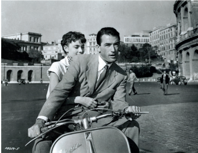
Audrey Hepburn et Gregory Peck dans « Vacances romaines » en 1953

1951 : une jeune actrice, Audrey Hepburn, débarque à Hollywood. Très vite, après quelques rôles dans des films mineurs, elle sera remarquée par de grands réalisateurs, tel William Wyler avec lequel elle tournera « Vacances romaines ». Le film est un immense succès et Audrey Hepburn reçoit l'Oscar de la meilleure actrice à vingt-quatre ans seulement. En 1954, le film « Sabrina » remporte l'Oscar de la meilleure création de costumes grâce au talent d'Hubert de Givenchy. Audrey Hepburn jouera au total dans une trentaine de films et sera nommée aux Oscars à quatre reprises.